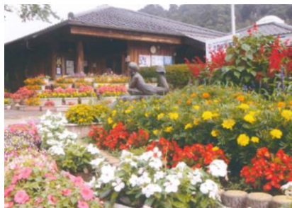
〈花壇のアピール写真〉